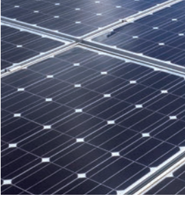
Vitovolt 300 monokristal fotovoltaik modül

Güneşten gelen elektrik: Türkiye’de kişi başına düşen ortalama elektrik tüketimi miktarı az sayıda modül ile karşılanabilmektedir.